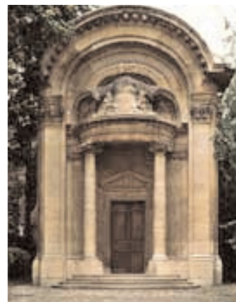
Is é séipéal Choláiste na Lombardach an t-aon iarsma amháin den chéad Choláiste Éireannach a tháinig slán go dtí an lá inniu. Sa lusca ansin, tá scata d’Éireannaigh cháiliúla curtha, daoine a tharraing cáil orthu féin toisc baint a bheith acu leis an Coláiste sin ó thús.

Ba é Montesquieu a dúirt gur bhain na mic léinn as Éirinn Páras amach “gan pingin ina bpócaí ach le tallann na