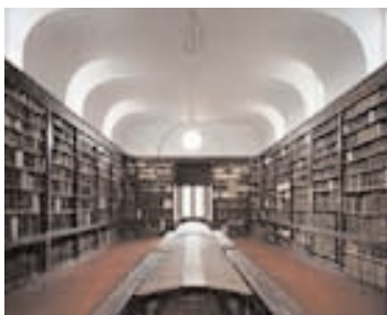
Sa leabharlann tá scríbhinní, cuid mhaith acu atá neamhchoitianta agus luachmhar ar fad, agus ní de bhunadh Éireannach amháin iad, óir tháinig sciar díobh ó na leabharlanna a bhí ag na Coláistí Caitliceacha eile i bPáras, sular comhaontaíodh le chéile iad.

dealbh de Mhuire Ógh leis an Leanbh Íosa, agus tá sé sin suite i gcuas faoi bhun na príomh-altóra. Díreach os cionn an tséipéil is ea atá an leabharlann agus í suite in áiléar bogtach agus séala na simplíochta go hiomlán uirthi. Is ansin a cuireadh i dtaisce an séad fine is mó as measc na lámhscríbhinní Gaeilge sa Choláiste – Leabhar Mór Leacáin a scríobhadh idir 1390 agus 1418. Cuireadh ar sábháil an lámhscríbhinn sinn sa leabharlann ar feadh an chuid is mó den XVIII céad go dtí gur seoladh thar ais í slán ó chontúirt