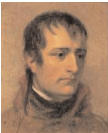
Chuir an Príomh-Chonsal, Napóilean I (“Impire” ina dhiaidh sin) suim sa Bhriogáid Éireannach agus i gColáiste na nÉireannach. Ar scaoileadh do na reisimintí Éireannacha i 1791, bhunaigh Napóilean Léigiún Éireannach agus thíolaic sé a bhratach pearsanta dó.

athrú. Níor lúide an t-athrú a tháinig ar Choláistí na nÉireannach ar an Mór-Roinn dá bharr agus ba é an dála chéanna ag an gColáiste i bPáras é. I measc mhuintir na hÉireann bhí an teanga Ghaeilge féin ag dul ó chion agus bhí formhór na ndaoine a raibh bara na himirce fúthu ag aimsiú ar na tíortha ina labhraí Béalra le saol nua a bhaint amach dóibh féin.