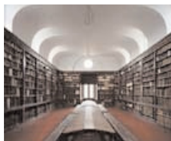
La bibliothèque possède bon nombre de pièces rares et de grande valeur, non seulement d'intérêt irlandais mais provenant aussi des collections des autres collèges catholiques parisiens avant leur fusion.