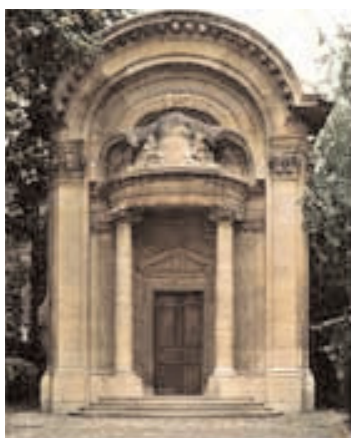
La Chapelle du Collège des Lombards, rue des Carmes, est tout ce qui subsiste du premier Collège Irlandais. Dans la crypte sont enterrés plusieurs Irlandais illustres dont les noms restent associés aux débuts de l'institution.

prêtres et étudiants qui suivaient des cours à l'université. Leurs programmes d'études pouvaient varier. Bon nombre des plus jeunes étudiants commençaient par acquérir une base solide en sciences humaines, essentiellement en latin. Ces études étaient généralement suivies d'un cursus de philosophie de deux ans, débouchant sur une maîtrise ès arts, stade auquel l'étudiant