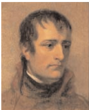
Le Premier Consul, futur Empereur Napoléon 1er, s'intéressa à la Brigade Irlandaise et au Collège des Irlandais. Les régiments irlandais ayant été dispersés en 1791, Napoléon créa une Légion Irlandaise, à laquelle il offrit son propre drapeau.