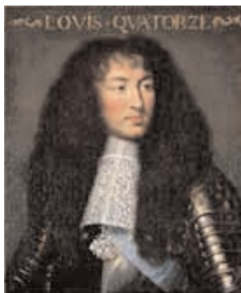
En 1677, par lettres patentes, Louis XIV fit don aux Irlandais du Collège des Lombards, ancien établissement italien datant de 1330, assorti de "tous les privilèges, droits et exemptions dont jouissent les Collèges fondés en faveur des Français".

Au cours du XVII e siècle, la relative pauvreté des étudiants irlandais voyageant vers le continent était un problème récurrent. C'est pourquoi il devint de plus en plus courant de procéder à l'ordination des étudiants en Irlande, alors généralement âgés de vingt-cinq ans ou plus, avant qu'ils ne partent à l'étranger pour leur enseignement supérieur. Ainsi, en tant que prêtres ordonnés, ces étudiants pouvaient subvenir modestement à leurs besoins en officiant pendant leur séjour à l'étranger. Cette pratique était indubitablement une réussite et permit à des étudiants aux origines les plus modestes d'obtenir une éducation et une carrière cléricale. Cependant il y eut également des problèmes, principalement dus au fait que les étudiants les plus âgés qui avaient déjà été ordonnés se conformaient moins à la vie disciplinée du collège.