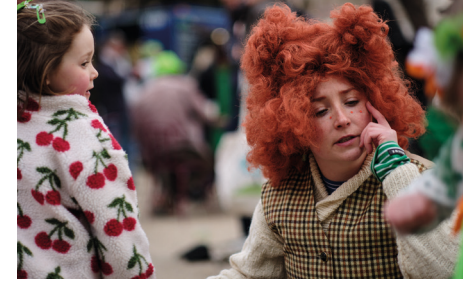
St Patrick's Family Day