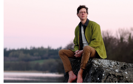
« Listen to the Land Speak »